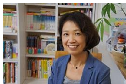
笑顔が素敵な馬場ワーキングリーダー

という話を聞いたからです。私は就労移行支援 Small Steps(スモールステップ)なゆたという事業所で精神障害者の就労を支援する仕事をしています。うまく行くことばかりではありません。袋小路に入り込み、自信を無くすことも多いです。そういう時に、しごと部会のネットワークに何度も助けていただいています。「たのしい」、「相互交流」、「明日から使える」そんな研修会を仕掛けたい！ワーキングメンバー 7 名でただいま頑張っています。